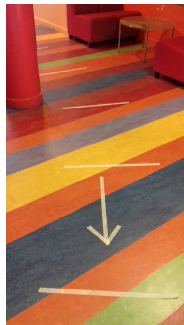
Marquage au sol et sens de circulation

Anticiper les scénarios possibles de reprise des enseignements (composition des groupes d'élèves, emploi du temps...) en prenant en compte les locaux et matériels disponibles, personnels et élèves présents. Ces scénarios seront à évaluer et ajuster à chaque fin de semaine.