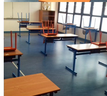
Exemples d'organisation d'espaces «classe»