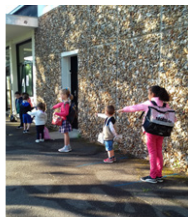
Apprentissage de la distanciation